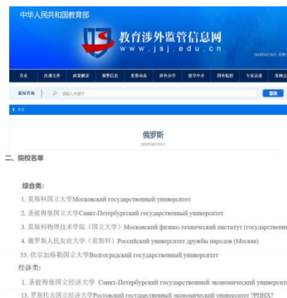
中国教育部涉外监管信息网