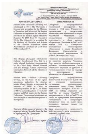
萨拉国立技术大学授权