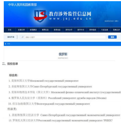
中国教育部涉外监管信息网