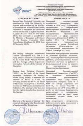
萨拉国立技术大学授权