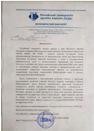
人民友谊大学授权